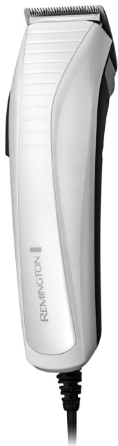
ColourCut Clipper HC5035